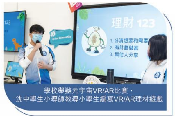
學校舉辦元宇宙VR/AR比賽，沈中學生小導師教導小學生編寫VR/AR理財遊戲

「眾善奉行教導我們，只要是善行，無論大善小善都要盡力做。」何老師指學校著重學生在社會服務上的參與，亦希望科技教育也能與善行結合。學校與香港大學及資訊科技教育領袖協會舉辦學界首個 元宇宙VR/AR比賽 給小學生，安排學生作為「小導師」教導小學生如何透過編程編寫VR/AR遊戲，讓學生以「自利利他」的精神將學習到的知識傳承。何老師更與友校老師及學會合作，將校本元宇宙課程教材出版成教學書，派發至全港中小學，分享教學成果。此舉讓學生明白到除了學習知識之外，也學會與別人分享。何老師相信這樣會為學生帶來更深刻的意義，亦有助STEM教育的未來發展。