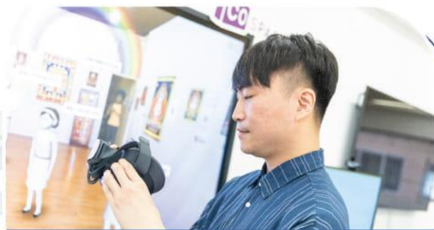
將元宇宙概念與CoSpaces EDU 結合引發學生的學習興趣